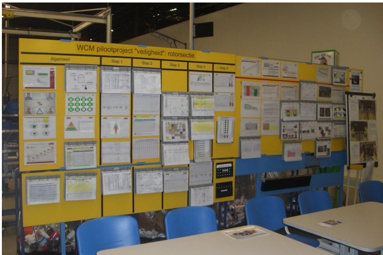
Foto: 'verpozingslokaal' werknemers, met uitgebreide communicatie rond WCM

Sinds 2008, bij de opstart van het programma, is de IFI (Injury Frequency Index) gezakt van 2,7 naar 0,5 – pas op, gerelateerd naar 100.000 uren in plaats van de door ons gehanteerde 1 miljoen uren. Daartegenover zijn de gemelde onveilige handelingen en condities enorm gestegen, want dit is juist de bedoeling, dit volledig in lijn met de praktische betekenis van de Heinrich pyramide.