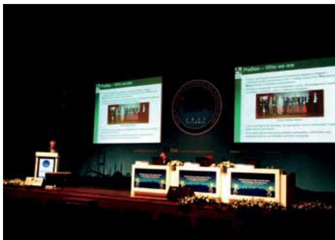
Eddy Eyckmans gaf een presentatie over WikiPreBia in de speakers corner