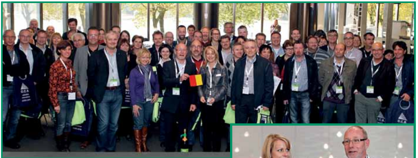
Hier poseren de beursbezoekers van PreBes tijdens de eerste dag

Bij aankomst in de gebouwen van het Messe Congress Center in Dusseldorf, werden de busreizigers telkens uitgenodigd door de organisatoren van de beurs op een kleine receptie.