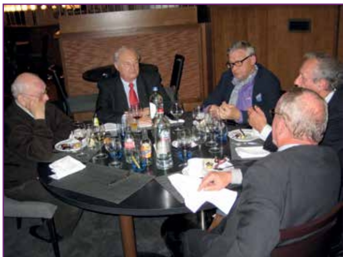
Rondetafelgesprek met de 5 voorzitters op 13 mei 2013

Het zou echt te ver leiden om in dit artikel alle goede raad en strategieën te vermelden die werden aangereikt aan de huidige voorzitter. Er was duidelijk verschil in aanpak te merken en er werd niet getwijfeld om één en ander te weerleggen. Het 'ownership', de verbondenheid en verantwoordelijkheidszin met en voor de vereniging, was bij ieder nog steeds zeer groot en dat onafgezien van hun leeftijd.